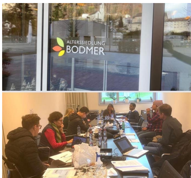
Der Vorstand am Arbeitsg im AH Bodmer